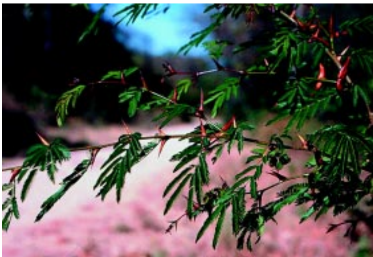
Figura 2. Espinhos modifica- dos (occos) para o abrigo de formigas Pseudomyrmex são encontrados nessa espécie mirmecófito da América Central, do gênero Acacia , estudada pelo ecólogo Daniel Janzen

formigas Pseudomyrmex com plantas do gênero Acacia (figura 2), que ocorrem na América Central e no norte da América do Sul.