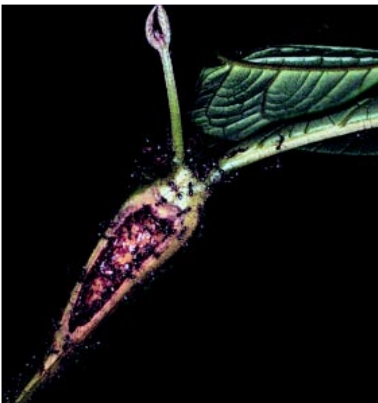
Figura 3. Corte transversal de uma domácea da planta Cordia nodosa , mostrando as formigas Azteca que vivem em seu interior

Na Amazônia peruana, as formigas do gênero Myrmelachista que habitam as domáceas de Tococa guianensis e Clidemia heterophylla (ambas da família Melastomataceae) chegam a matar a vegetação competidora em volta da planta que elas ocupam – o que é chamado de atividade herbicida. Em alguns casos, as formigas associadas também podem fornecer nutrientes essenciais para a planta a partir dos detritos (o ‘lixo’ da colônia) que depositam dentro das domáceas. Também é sabido que plantas com o tronco oco, como as embaúbas (gênero Cecropia , família Cecropiaceae), podem usar, durante a fotossíntese, o gás carbônico gerado pela ação das formigas nas domáceas.