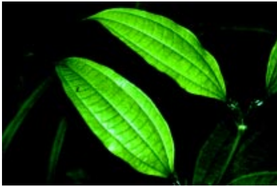
Figura 5. As folhas de Tococa bullifera , outra planta estudada pelos autores, também têm formigas morando no interior de suas domáceas

espécies de planta, mas Azteca sp. só é encontrada em T. bullifera e P. minutula apenas em M. guianensis .