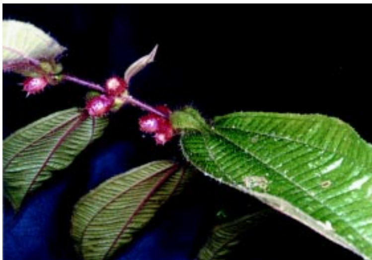
Figura 4. Ramo de Maieta guianensis , uma das plantas estudadas pelos autores, mostrando as domáceas (bolsas verdes na base das folhas) – sem as formigas Pheidole minutula , que a defendem contra insetos herbívoros, M. guianensis perde grande quantidade de folhas e pára de produzir frutos (as bolinhas vermelhas)

O número exato de espécies de formigas que mantêm associação com plantas mirmecófitas na Amazônia é desconhecido, mas não deve superar duas centenas. A maioria dessas formigas pertence aos gêneros Myrmelachista , Pseudomyrmex , Pheidole , Crematogaster , Azteca e Allomerus , esse último um gênero peculiar por estar exclusivamente associado às mirmecófitas.